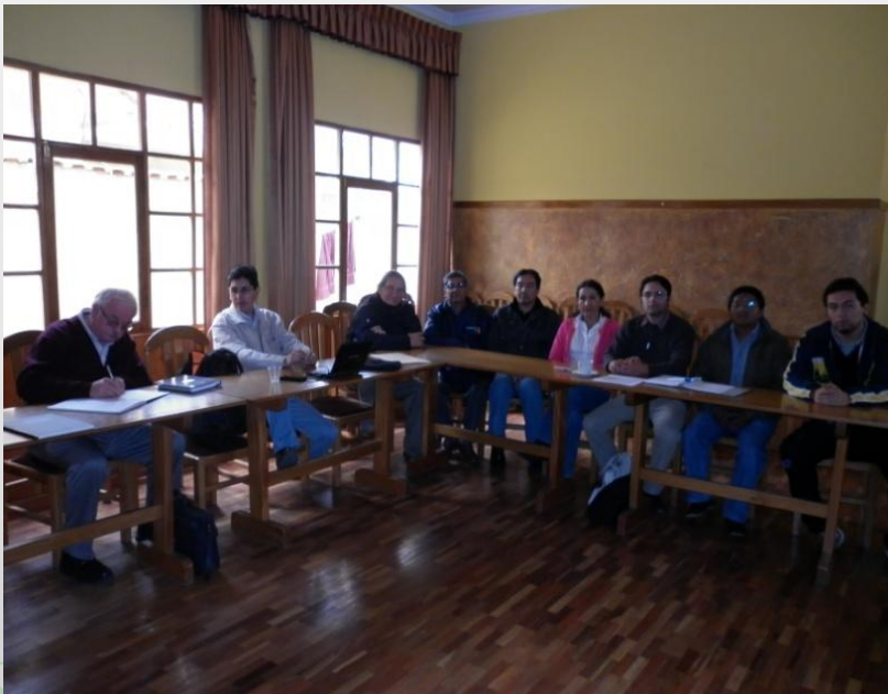
Firma del acta de constitución