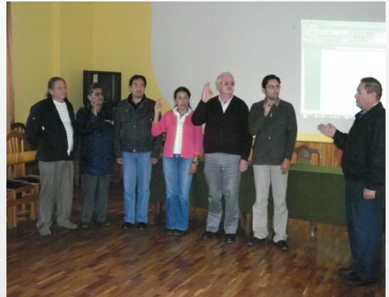
Acto de posesión de Concejo Directivo